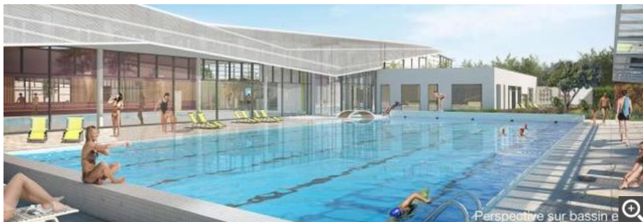
Le bassin nordique (extérieur) du futur complexe aquatique.

Suite des inondations. Gilles Clément est revenu sur les inondations qui ont touché le territoire et a souhaité que la communauté de communes « organise la solidarité à son échelle et vienne en aide aux communes et éventuellement aux entreprises avec un fort reste à charge ». Il a invité les conseillers à réfléchir à l'éventualité d'un fonds de solidarité, en sollicitant l'État et la Région, et après étude des besoins. Soulignant ensuite qu'il faudrait « savoir tenir compte de ce qui s'était passé ».